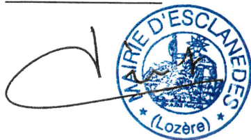
Table décennale des actes de naissances certifiée exacte, Esclanèdes, le 11 avril 2003, Le Maire, Bernard PINOT