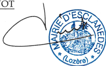
Table décennale des actes de reconnaissances prénatales certifiée exacte, Esclanèdes, le 11 avril 2003, Le Maire, Bernard PINOT